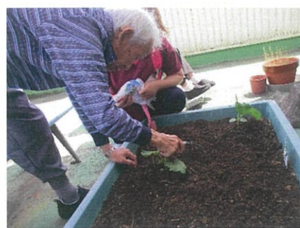
「たくさん収穫できるかな？」

できる限り新型コロナウイルス感染症対策をしながら、皆さんリハビリに一生懸命取り組んでおられます。施設からの外出については控えて頂いていますが、5階テラスで外の空気を吸って太陽の光を浴びて免疫力アップ、リフレッシュの機会をつくっています。