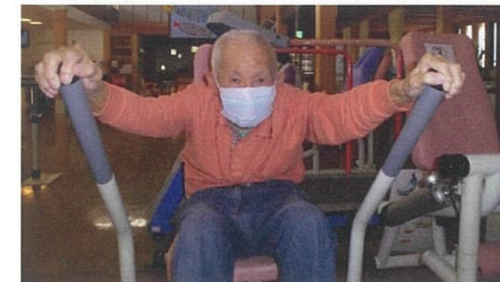
トレーニングマシンを使ってリハビリ中 「ボート漕ぎ運動」 腕、胸、背中筋力強化や筋持久力強化の効果があります。