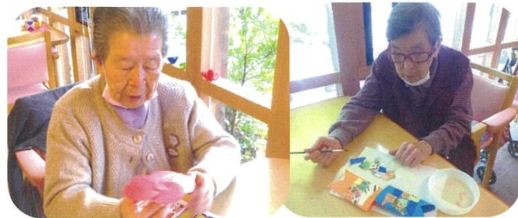
小さな鯉のぼりを並べて 大きな鯉のぼりの完成♡♡