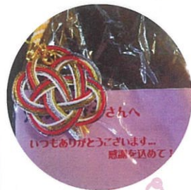
母の日の プレゼント