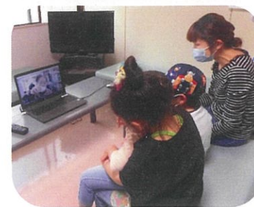
おばあちゃん 元気?

新型コロナウイルス感染症拡大防止による面会制限が続いており、ご家族の皆様にはご不便とご心配をおかけしております。4月20日より「テレビ電話」による面会対応を開始しています。ご家族の方は1階団らんコーナーにて実施となります。「元気そうにしている安心しました」(ご家族)「孫の顔が見られて嬉しかった」(ご利用者)等々の感想を頂いています。