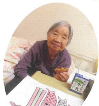
おやつタイム 今日どら焼きで〜す