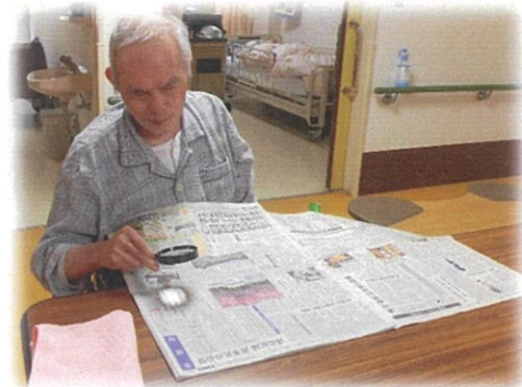
新聞を読むのが日課