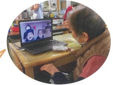
元気にしょう るで!