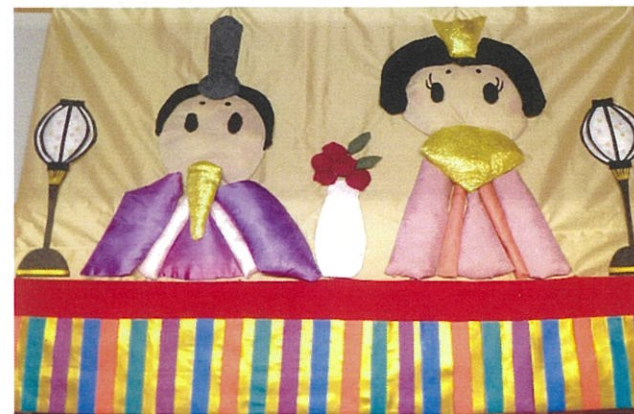
3月の壁画 「おひな様」