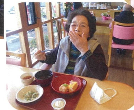
お寿司が美味しいね！！