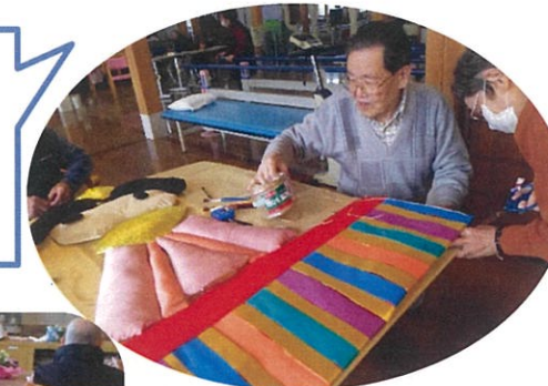
お雛様の衣装を作っています。色とりどりできれいだな～