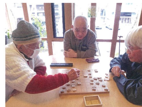
将棋で対戦 どっちが強いかな？