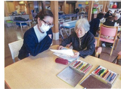
実習生と一緒にカレンダー作成