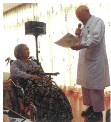
「あらた会」の皆さんによる歌謡ショー