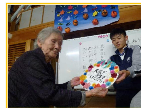
高梁市健康福祉のつどい 10月13日(土)~19日(金)