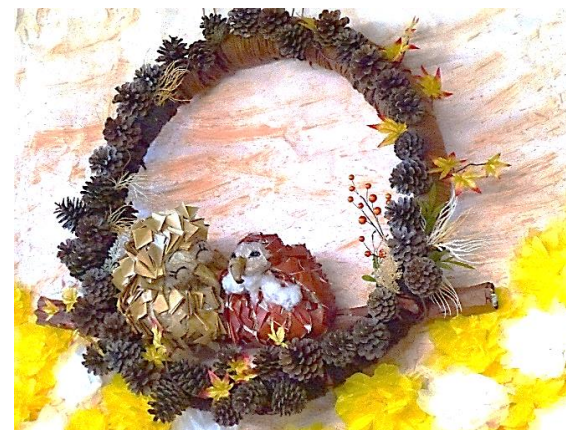
11月の壁画「ふくろうの親子」