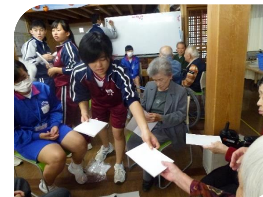
高梁城南高校や高梁北中学校の生徒に よる施設実習(レクリエーション)