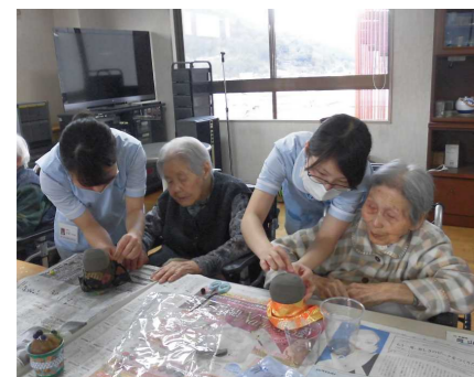
地域の方の来所もたくさんあり、楽しく賑やかに芝雛人形を作りました。芝が生えてくるのが楽しみです。