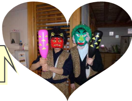
私たち頑張りました。 鬼もけっこう大変ですね。