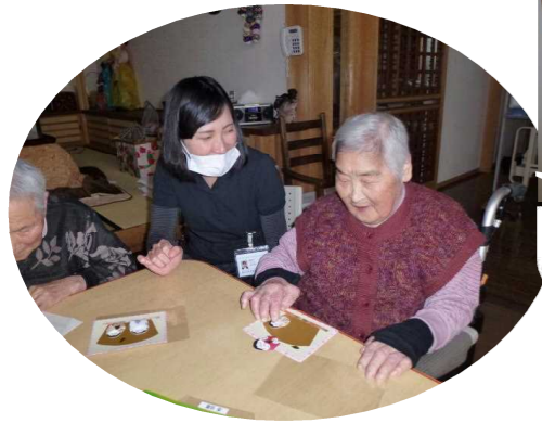
お雛様カード 学生さんと頑張って作ってます。