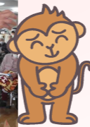
職員による寸劇「桃太郎」