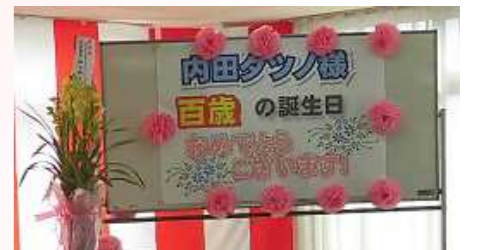
内田タツノさんが100歳の誕生日(T5. 2. 13生)を迎えられました。いつもニコニコ笑顔が素敵です。おめでとうございます。