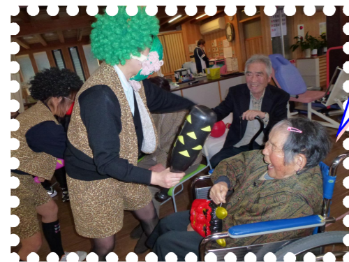
鬼は外 鬼さん そばに寄ら ないで!!