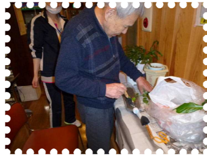
作業療法で花を植えました。