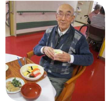
にぎり寿司がおいしかったな～