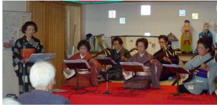
12月10日勝志世会による三味線の演奏